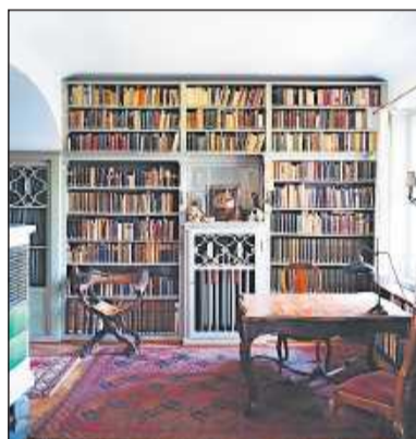
Rund 5000 Bände umfasst C. G. Jungs Bibliothek.

seinem Zimmer aufhing. Ihn faszinierte die Landschaftsmalerei des 19. Jahrhunderts ebenso wie mittelalterliche Kunst. Gemälde hatten ihn schon früh in ihren Bann gezogen. Eine seiner Kindheitserinnerungen beschrieb Jung so: „Oft schlich ich heimlich in den abgelegenen, dunklen Raum und saß stundenlang vor den Bildern, um ihre Schönheit anzusehen. Es war ja das einzig Schöne, das ich kannte.“