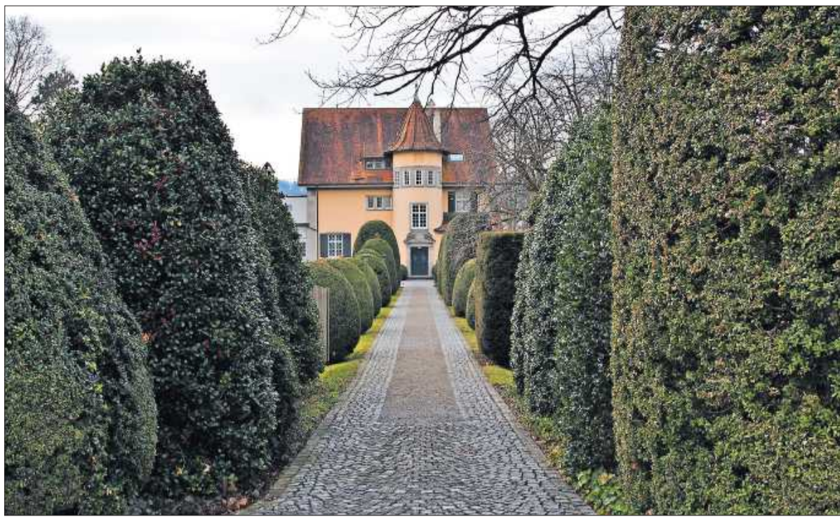
Selbst entworfen hat C. G. Jung die Pläne für sein Haus und den Garten in Küsnacht am Zürichsee.