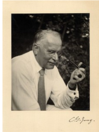
Foto: ETH-Bibliothek Zürich, Bildarchiv / Fotograf: Unbekannt / Portr_14163 / Public

C.G. Jung. Bild und Wort . (Hrsg. Aniela Jaffé, Olten 1977, S. 143f.)